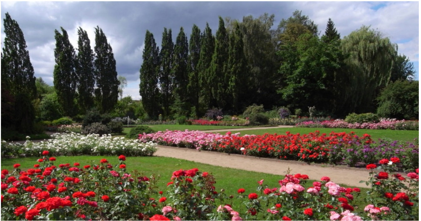
Rosengarten Pinneberg: Sommerfreuden und Blumenfeste