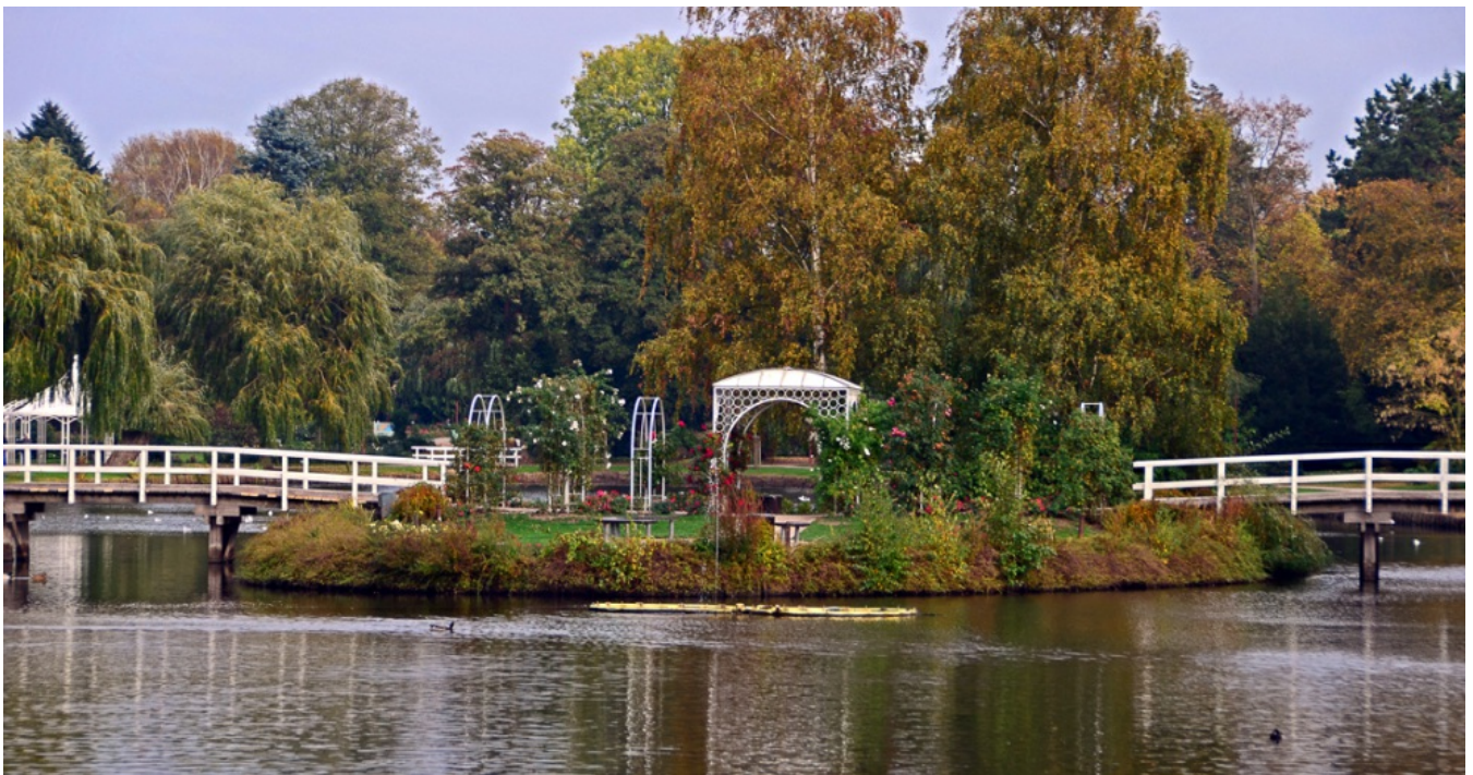
Rosarium Uetersen: Blütenpracht der Rosenstadt