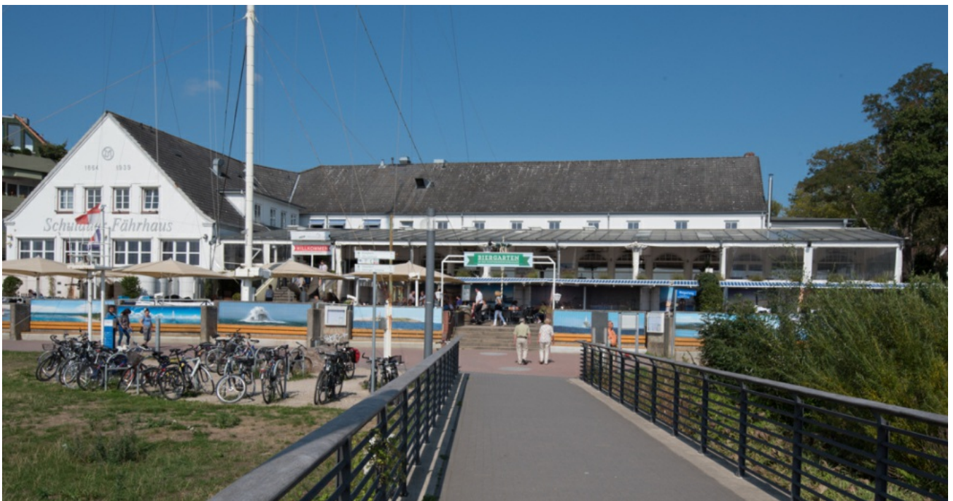
"Willkomm Höft" in Wedel: Grüße an Schiffe aller Länder