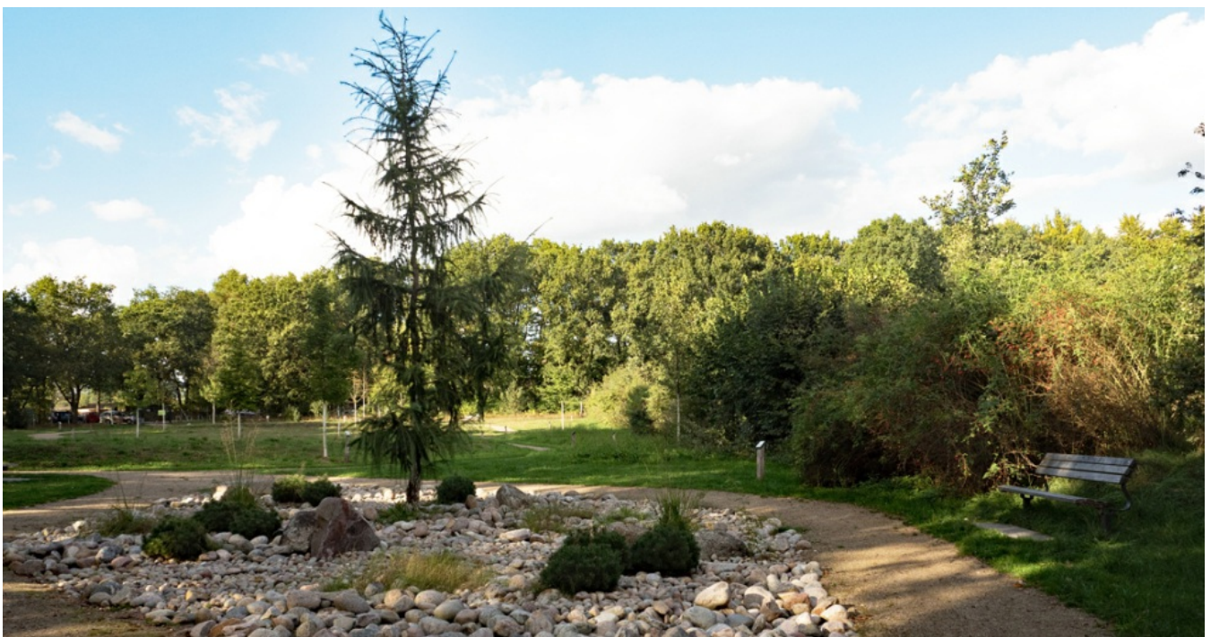
Baupark Pinneberg: Die Bäume des Jahres