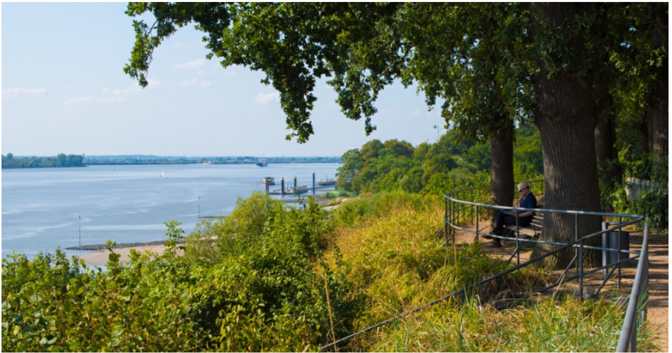
Johann-Rist-Weg in Wedel: Vom Parnass in den Kräutergarten