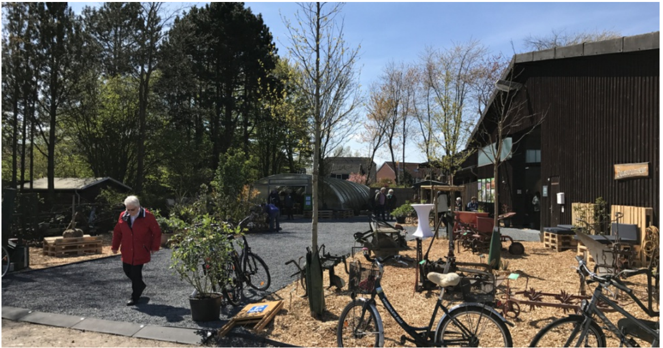
Deutsches Baumschulmuseum Pinneberg: Muldbretter und Pflanzenjäger