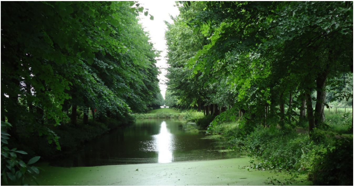
Seestermühe Linden-Doppel-Allee: Ordnung und Freiheit