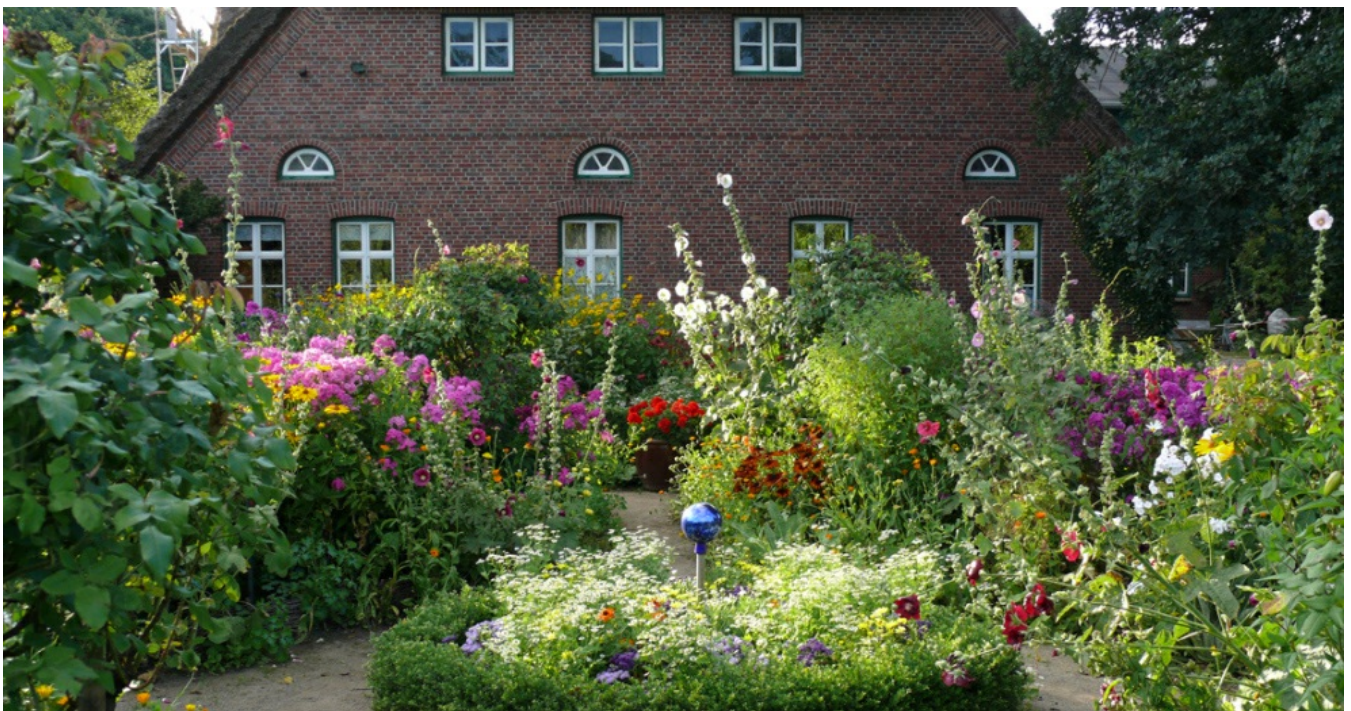
Arboretum Ellerhoop: Norddeutsche Gartenschau