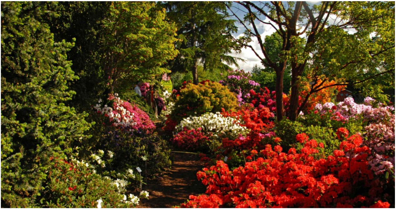
Baumschule Hachmann: Leidenschaft Rhododendron