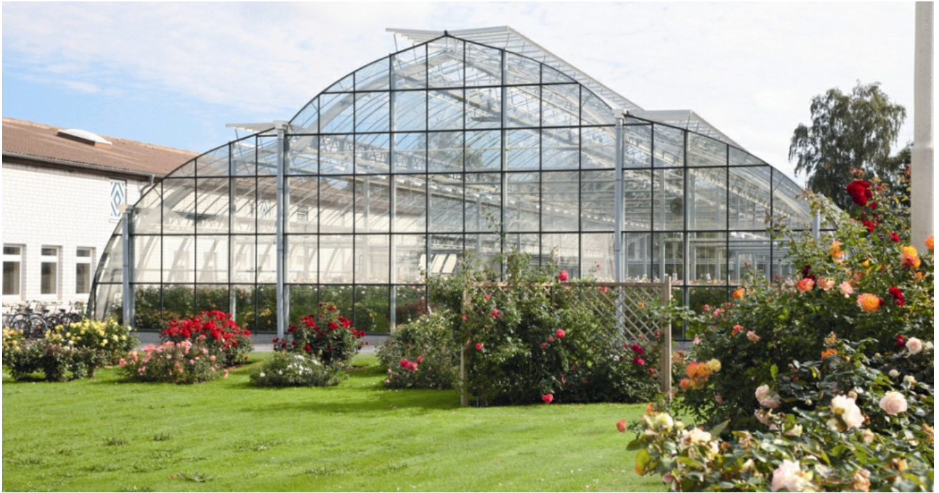
Rosen-Tantau in Uetersen: Über 100 Jahre Züchtergeschichte